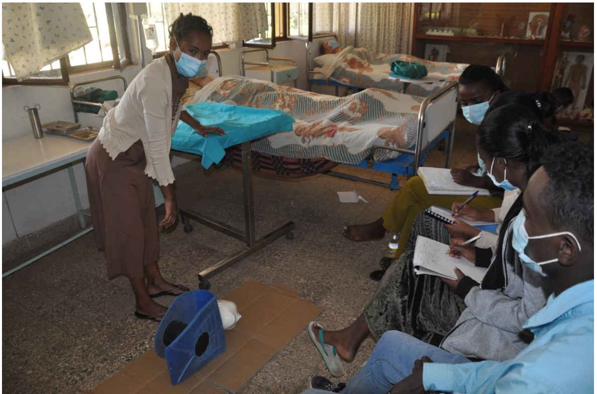
Una dimostrazione pratica di rianimazione