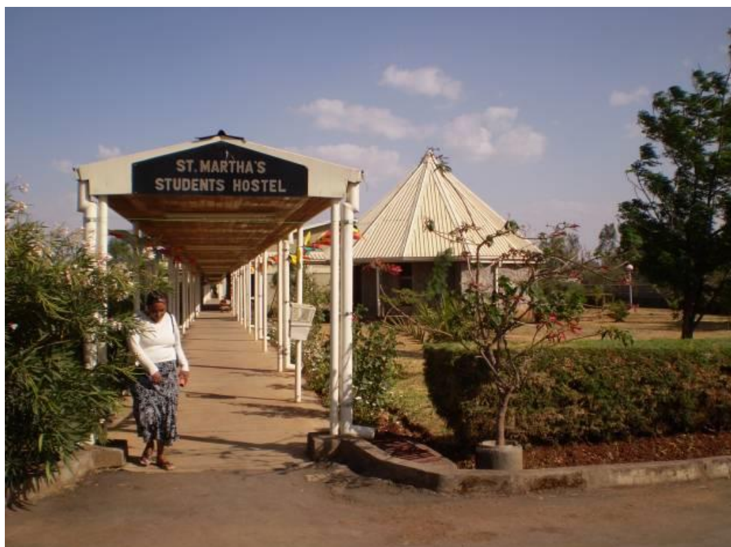
L'ingresso dell'Ostello Santa Marta dove sono alloggiati gli studenti interni della Scuola