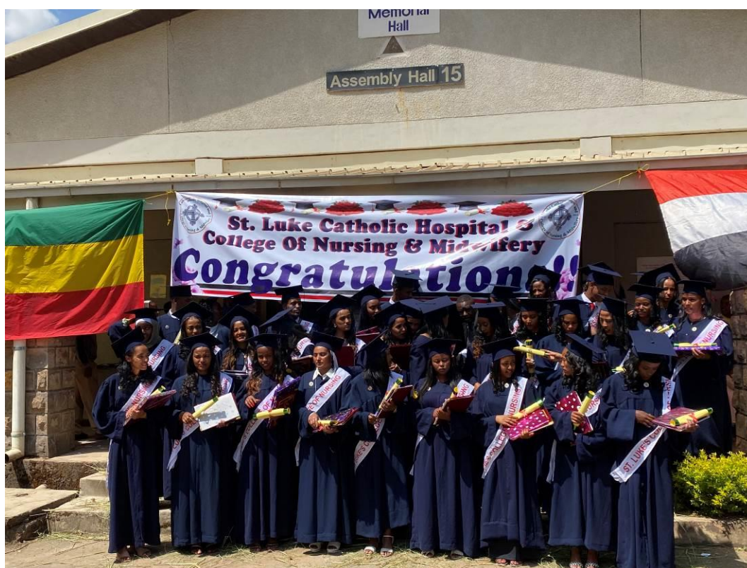
29 gennaio 2023, 20° cerimonia di consegna dei diplomi presso la Scuola di Wolisso