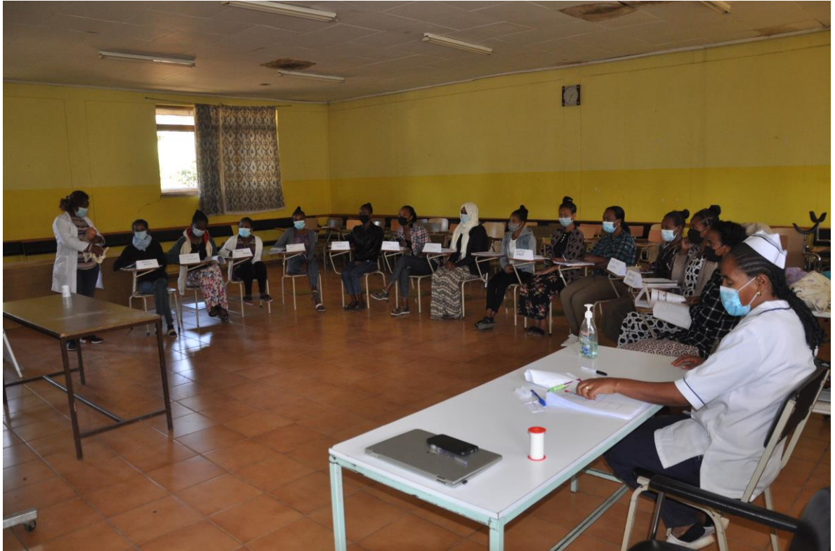
Gli studenti durante una lezione frontale