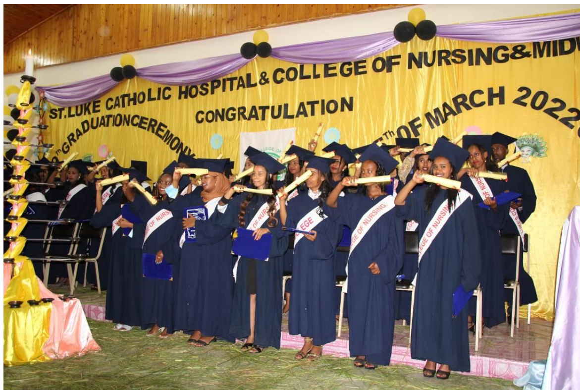
Cerimonie di diploma 2022

Lo scorso 5 marzo 2022 si è tenuta la cerimonia di consegna dei diplomi agli studenti e le studentesse del triennio 2019-2021